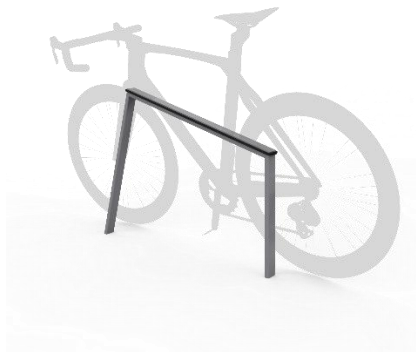
referenční obrázek – stojan na kola