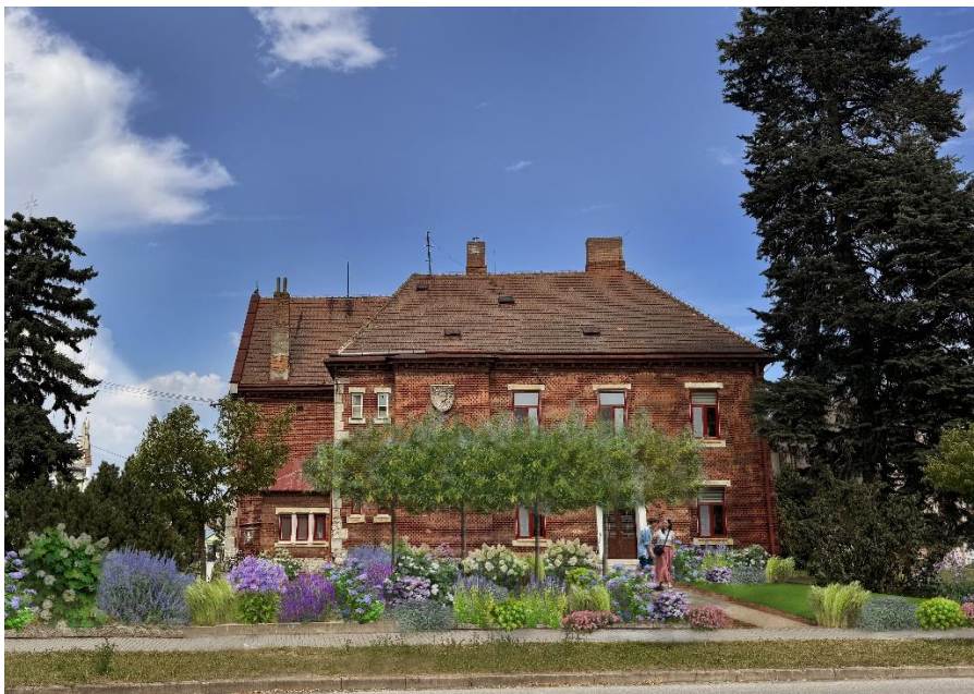
Vizualizace navrhovaných stromů v mlatu a trvalkových záhonů