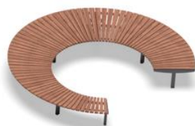
referenční obrázek – dřevěná lavička