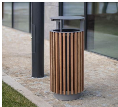
referenční obrázek – odpadkový koš se stříškou

Viz výkres D 3.2 Charakteristické detaily – odpadkový koš