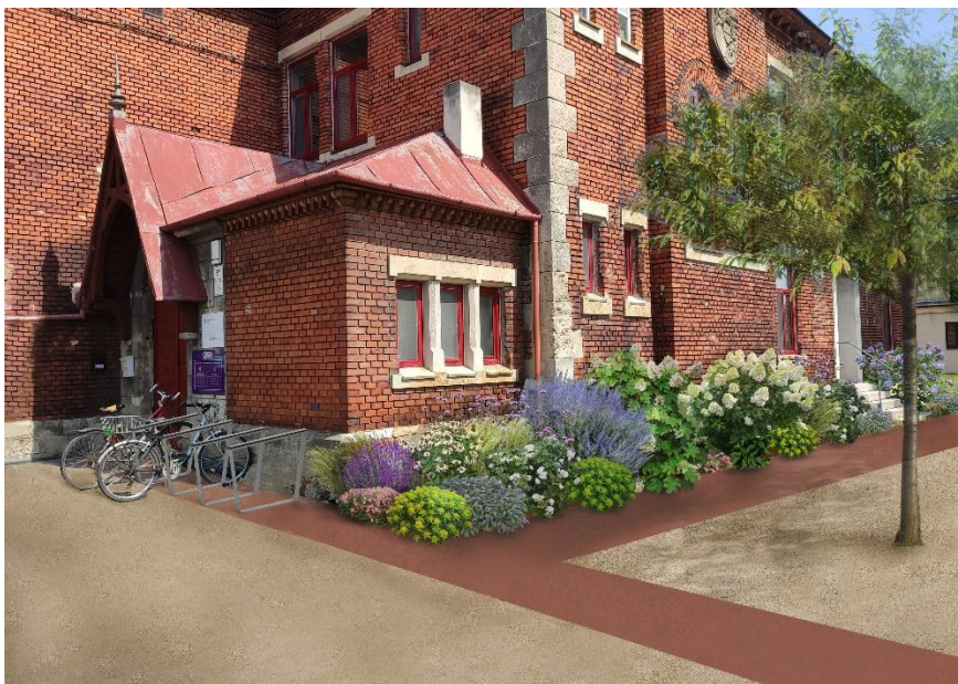
Vizualizace navrhovaných trvalkových záhonů