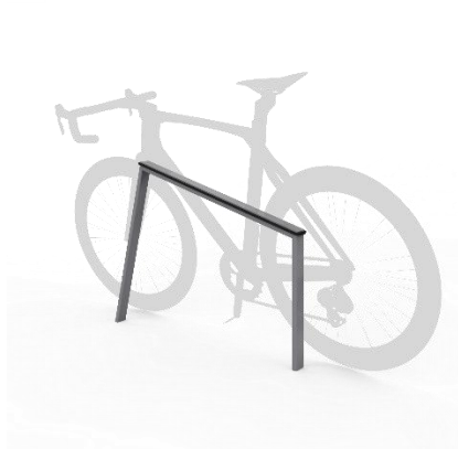
referenční obrázek – stojan na kola